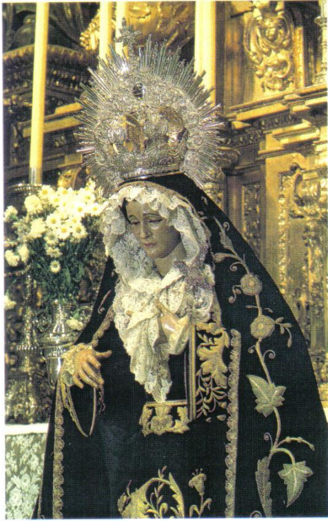
• Maria Santísima de las Tristezas