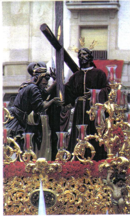
Nuestro Padre Jesús de la Victoria