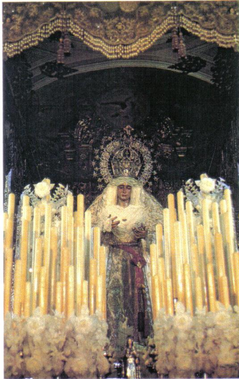
• Maria Santísima de la Paz